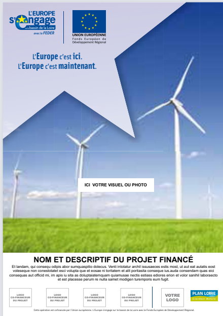
→ Exemple d'affiche (format A3).