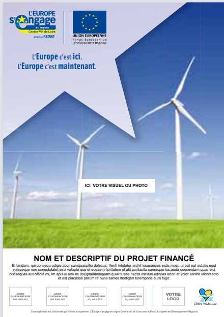
→ Exemple d'affiche (format A3).