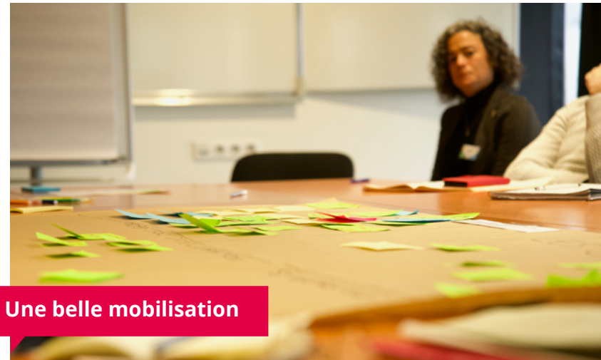
Une belle mobilisation