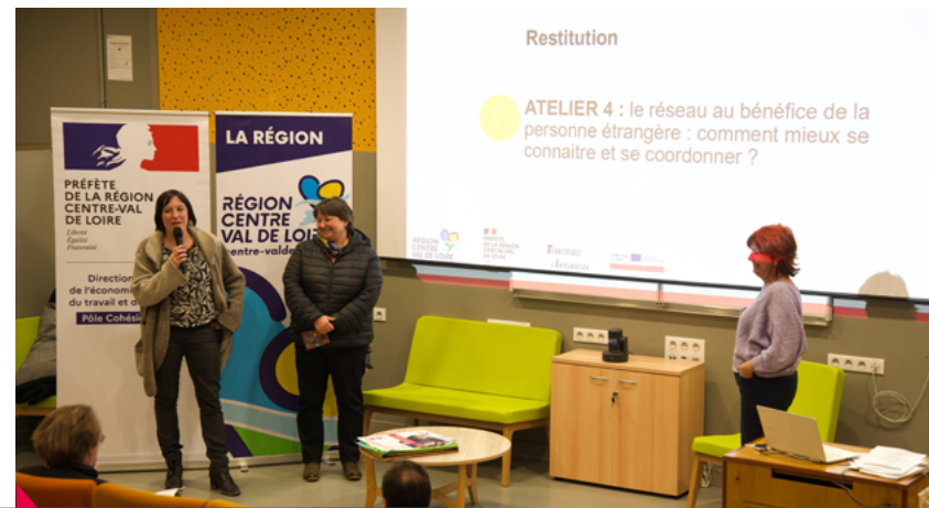
Une envie de se rencontrer