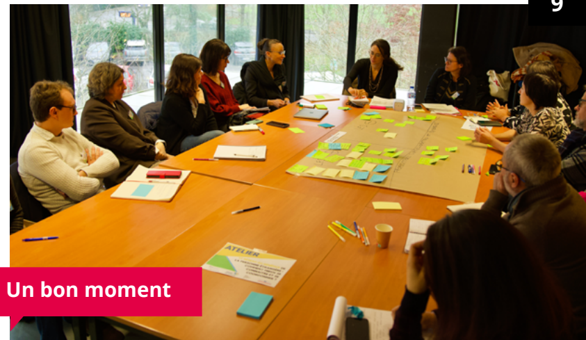
Un bon moment

« Nous n'avons pas de proposition pour déterminer qui s'occupe de l'actualisation de la plateforme... »